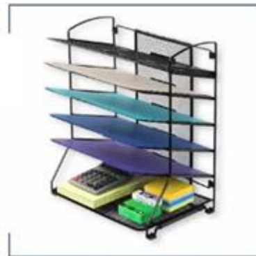
투명 클리어 파일 속지, 파일, 문구 수납함, 파일 거치대