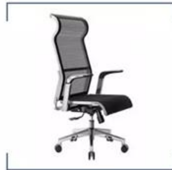
조절식 사무용 책상, 화이트보드 세트, 사무용 의자