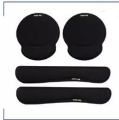
칠판 스티커, 투명 북커버, 감사 카드, 키보드 마우스 패드