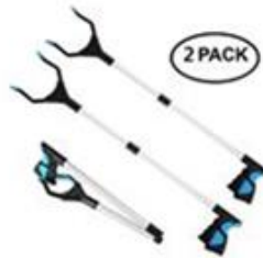
쓰레기 집게 Trash Pickers