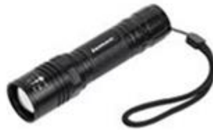
손전등 Handheld Flashlights