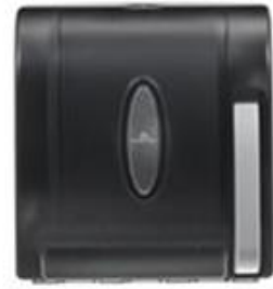
핸드타월 디스펜서 Paper Towel Dispenser