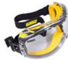
보안경 Safety Glasses