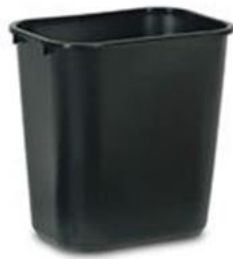
쓰레기통 Waste Bins

미국 아마존에서 청소용품 카테고리는 산업, 상업, 과학 연구 관련 카테고리에서 가장 큰 하위 카테고리 중 하나입니다. 정부, 병원, 학교, 기업, 공장 등 아마존 비즈니스의 거의 모든 기관 및 기업 고객이 청소용품을 구매하고 있습니다. 다만 업종별로 청소용품의 수요는 다르게 나타납니다. 예를 들어 건축 업체의 경우 타일, 카펫, 화장실, 유리창, 가구 세제의 수요가 많습니다. 종합적으로 볼 때 아마존의 대표적인 베스트셀러는 쓰레기통과 스탠드형 진공청소기입니다. 기업 구매자가 대량 구매하는 제품으로는 쓰레기봉투, 실험실 전용 청소용품, 상업시설의 화장실 유아 기저귀 교환대 등이 있습니다. 청소용품은 없어서는 안 될 필수 카테고리이므로 자체적인 디자인과 연구 개발 능력을 보유한 관련 기업의 경우 발전 가능성이 매우 클 것으로 예상됩니다.