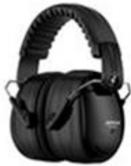
방음 귀덮개 Safety Ear Muffs

산업용 보호구 제품은 성능과 사양, 재질, 공정 표준화율이 높아 아마존에서 상대적으로 성숙한 산업 분야에 속합니다. 미국 아마존의 대표적 베스트셀러는 방음 귀덮개, 손전등, 보안경 등이며 다양한 업종의 기업 구매자의 제품 구매 빈도가 높습니다. 그 중에서도 특히 학교, 제조업, 건축업, 정부기관이 두드러집니다.