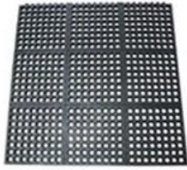
상업용 미끄럼 방지 고무 매트 Commercial Anti-Fatigue Rubber Matting